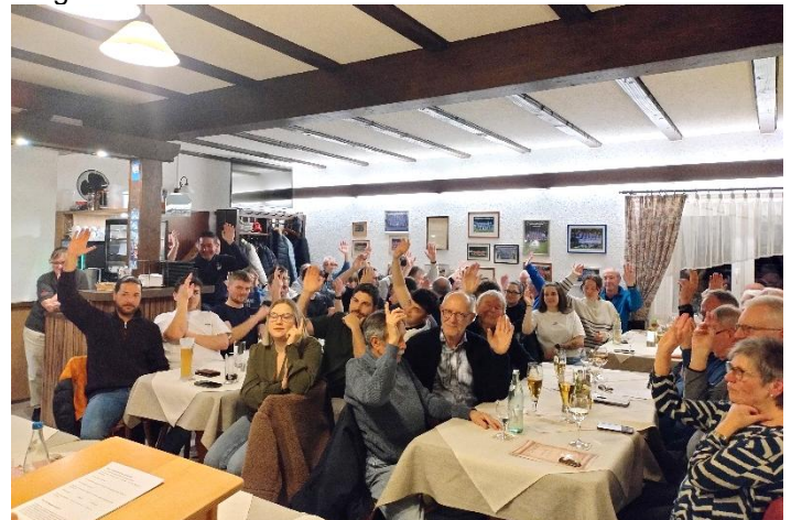
Eindruck von der Mitgliederversammlung